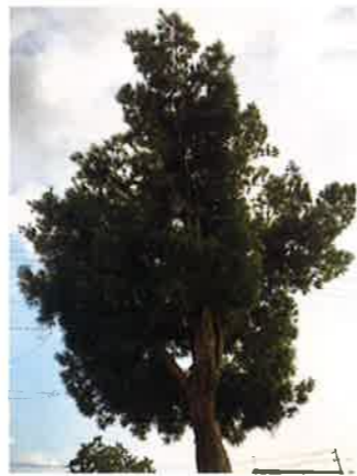
古から家、家族を見守ってきた代々の樹