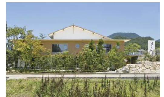
11号線沿い「癒しの家」看板が目印

建設業許可番号:香川県知事許可(特・30)第1181号 ※つばや流が必要ない場合は、お手数ですが弊社までご連絡ください。