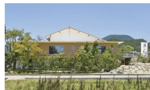
11号線沿い「癒しの家」看板が目印

建設業許可番号:香川県知事許可(特-30)第1181号 ※つばや流が必要ない場合は、お手数ですが弊社までご連絡ください。