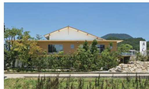
11号線沿い「癒しの家」看板が目印

一級建築士事務所:香川県知事許可(特-30)第1181号 ※つばや流が必要ない場合は、お手数ですが弊社までご連絡ください。