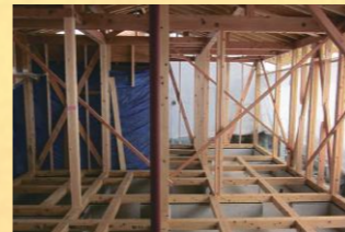
内部の骨組みの、防蟻・防腐処理が完了しました。