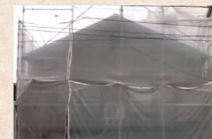
近隣対策(足場組立)

近隣対策(足場作成) → 目地打替 → 水洗い → 下地塗装 → 本塗装(2回) → 足場解体 → 完成