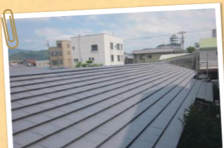
どんなお家出来るのでしょうか？楽しみですね。

高断熱外皮、高性能設備と制御機器等を組み合わせ、住宅の年間の一次エネルギー消費量がネット(正味)で概ねゼロとなる住宅のことです。例えば、断熱性能でいえば、昔の家のエアコンの消費量は、半分になります。